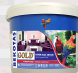
GOLD САТИН ГРУНТОВКА ГИПС