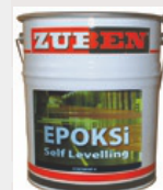
ВЕКОТАŞ ЭПОКСИДНАЯ СМОЛА НИВЕЛИРУЮЩАЯ