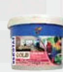
رنگ اسپری طلا