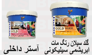
گلد سیلان رتگ مات ابریشمی سیلیکونی