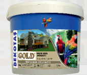
طلائی پوشش آماده تراسیت