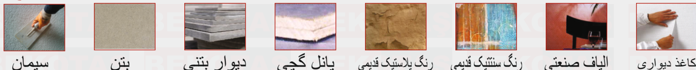
سیمان بتن دیوار بتنی پانل گچی رنگ پلاستیک قدیمی رنگ سنتتیک قدیمی الیاف صنعتی کاغذ دیواری

• برای به دست آوردن نتیجه بهتر از محصول نانو واش مات بعد از صاف کردن کلیه سطوح، استفاده از آستر داخلی نانو کلین باعث چسبندگی بهتر رنگ و نیز صرفه جویی در مصرف رنگ می شود. • قبل از استفاده محصول بر روی رنگ های قدیمی، باید سطوح کپک زده را با یک پارچه مرطوب کاملاً تمیز کرده و سنباده کشیده و گرد و غبار را به طور کامل از بین برد. اگر لکه و کپک از خشک شدن، لکه کاملاً بر طرف شود.