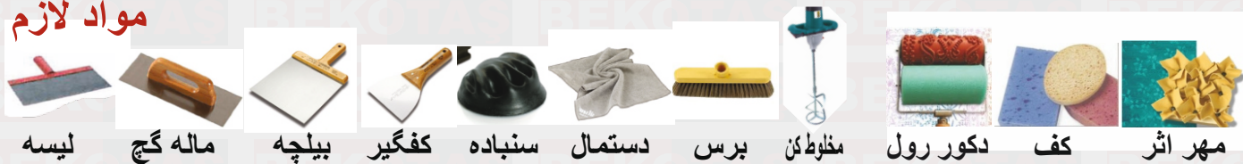
لیسه ماله گچ بیلچه کفگیر سنباده دستمال برس مخلوطکن دکور رول کف مهر اثر