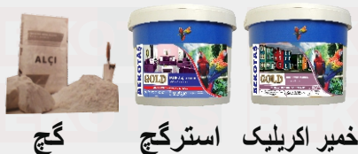
گچ خمیر اکریلیک استرکچ