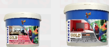
گلد دکوراتیو رنگ صدفی متالیک آستر داخلی