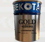
ضد خوردگی مصنوعی