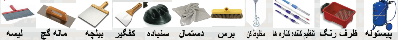
لیسه، ماله گچ، بیلچه، کفگیر، دستمال، برس، مخلوط کن، ظرف رنگ، تنظیم کننده کناره ها، پیستوله