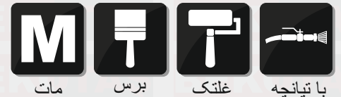
مات برس غلتک با تپانچه