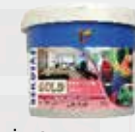
İç Cephe Astarı