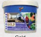
Gold Püskürtme Boya