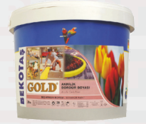
Gold Akrilik Bordür Boyası