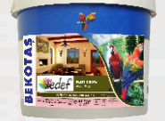
دهان بلاستيك لؤلؤي