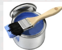
يتم طلاء الدهان للظف بالظف بماء نظيف بنسبة تصل إلى 10 في المائة من حيث الحجم ويتم تطبيقه في معظفين مع أسطوانة الفرشاة أو نظام الرش