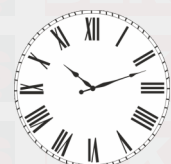
انتظر 6 ساعات على الأقل بين المعاطف