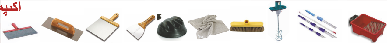
مكشطة مجرفة الجص مجرفة المعجون سكين المعجون مجرفة جليخ فرشاة سغب القماش خلاط الفطبل قابل للتعديل حاوية الرسام