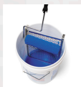
بل التطبيق ، يجب خلط الطلاء الداخلي الناتو بدقة