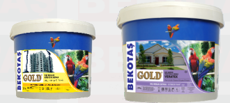
بطانة الخارجي كولد اكريليك تكستو رلو كرني وراتخ