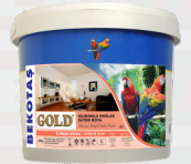
طلاء الذهب السليكوني اللميع الحريري