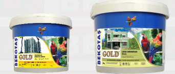
التهيدي الخارجي الاكريليك انزلاق العزل السميك المرنة الاكريليك